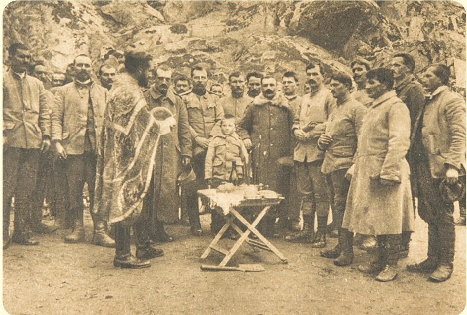
Благосиљање славских дарова српских војника у прошлости

Војни свештеници, односно верски службеници у Војсци Србије, професионална су војна лица високе стручне спреме и у статусу су официра Војске Србије. Поред тога, официри верске службе подлежу и канонској одговорности у оквиру Цркве, односно верске заједнице којој припадају. Због тога су српској војсци прописане и одређене специфичности статуса војних свештеника, односно верских службеника, и то су: не носе и не употребљавају оружје; обављају функцију командовања једино над својим помоћницима; обављају функцију саветника команданата и њима су директно потчињени; не могу бити позвани да сведоче о чињеницама и околностима које су сазнали приликом свете Тајне исповести; имају искључиво право на начин вршења богослужбених свештенорадњи током којих не